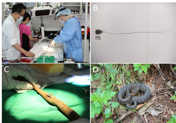
Fig. 1. Radio transmitter(s) being surgically implanted to the Red-tongue viper snake( Gloydius ussuriensis ) and the Short-tailed viper snake( Gloydius saxatilis ) captured in the field. (A) Veterinarians implanting radio transmitter(s), (B) A radio transmitter(PD-2, Holohil Systems®) used in the experiment, (C) The Red-tongue viper snake( Gloydius ussuriensis ) being operated on, (D) The Red-tongue viper snake( Gloydius ussuriensis , ID: U1) released after surgery.

본 연구를 위하여 쇠살모사와 까치살모사는 2012년 5월부터 10월까지 경기도 남양주시 화도읍에 위치한 천마산군립공원(37° 40'50"N, 127° 16'22"E)에서 까치살모사 6개체와 쇠살모사 5개체를 채집하였다. 채집 당시 개체들의 건강상태는 모두 양호하였으며, 형태적 기형이나 습성상 이상행동은 발견되지 않았다. 포획한 뱀은 실험실로 대려와 최소 0.1g과 0.1cm단위로 개체의 무게(Mass), 전체길이(Total Length), 몸통길이(Snout-Vent Length, SVL)를 측정하였다. 또한 연구종의 생존에 따른 적절한 발신기 무게의 범위를 알아보기 위해 Hardy and Greene(1999)가 권고한 방법에 따라 발신기의 무게를 전체체중에 대하여 5% 이내를 넘지 않도록 하였다(Diffendorfer et al., 2005; Tozetti et al., 2009; Klug et al., 2011; Wasko and Sasa, 2012). 삽입된 발신기(PD-2, Holohil Systems®, Fig. 1)의 무게는 3.8g이었고 전체 체중에 대한 발신기 무게 비율은 0.1% 단위로 측정하였으며, 측정된 모든 값은 소수점 둘째 자리에서 반올림하였다. 확인을 마친 뱀들은 수의사에게 맡겨져 Reinert and Cundall(1982)의 방법을 참고하여 총 11개체에 4차례( G. saxatilis : S, G. ussuriensis : U; 7월 16일 : S1, S2, U1, U2, U3; 7월 21일 : S3, U4, U5; 8월 17일 : S4, S5; 9월 5일 : S6)에 걸쳐 발신기를 개체의 피하에 삽입하였다(Table 1, Fig. 1).